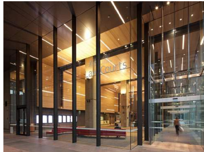
Queen Square Law Courts, Sydney (Australia)