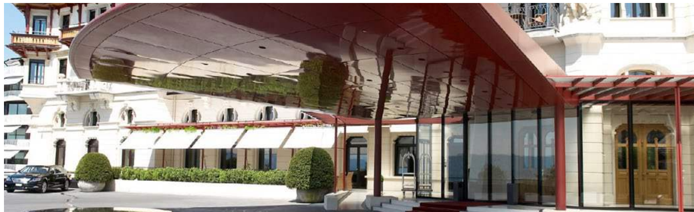
The Dolder Grand, Zurich (Elveția)