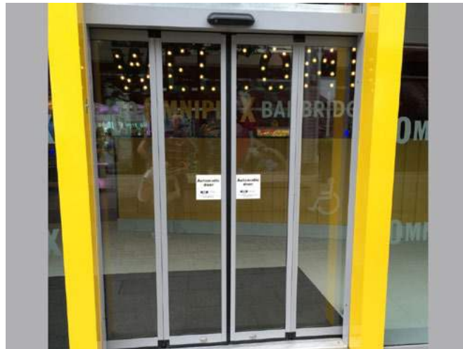
Omniplex Cinema (Irlanda)